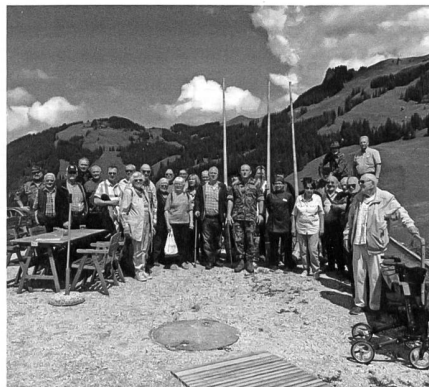
Gruppenfoto der Pensionäre der Ns S 45

In diesem Jahr werden die Hälfte der zehn direktunterstellten Kommandanten des LVb Log ausgewechselt. Über die Wechsel im Kompetenzzentrum Veterinärdienst und Armee Tiere, an der Instandhaltungsschule und im Kommando Ausbildungszentrum Verpflegung habe ich in den letzten Ausgaben berichtet. Im Herbst erfolgt noch der Wechsel in der Spital-