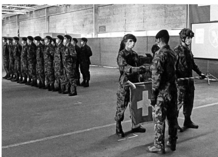
Beförderung der Küchenchefs

Le clé du succès est une subsistance bonne qui influence de manière positive le moral de la troupe.