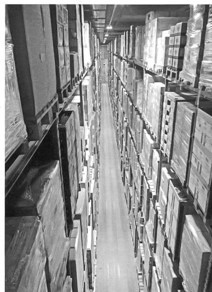
Sicht aus dem Gabelstapler

Der Rückschub umfasst knapp 10% der bestellten Güter. Es werden nur ganze Sammelpackungen und Produkte in einwandfreiem Zustand innerhalb der Haltbarkeit vergütet.