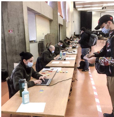
Aufnahme und Kontrolle der Personendaten