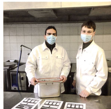
Liste der Verpflegungsverteilung