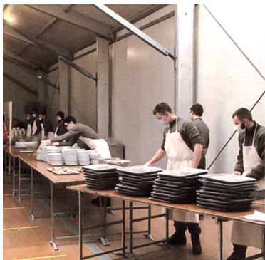
Vorbereiten der Fassstrasse