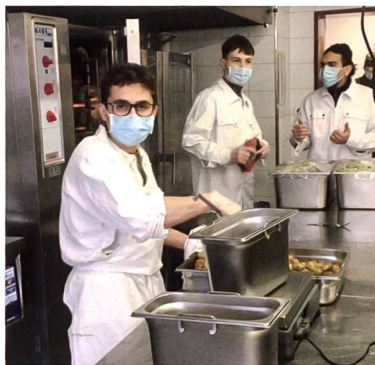
Aufteilung der Speisen