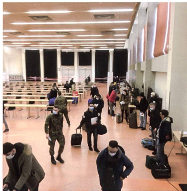
Empfang der Rekr