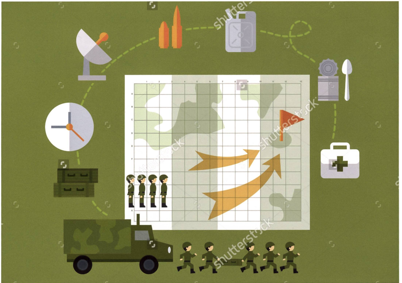
Military Logistics, Shutterstock