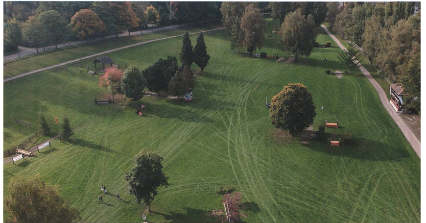
Aussengelände und Reitplatz