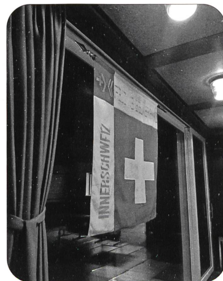
Das alte Sektionsbanner wurde mit viel Würde verabschiedet und in die verdiente Pension entlassen

Am Freitag, 15. November 2019 , nahm wieder eine mustergültige Fahndelegation der Sektion Innerschweiz, begleitet von einzelnen Sektionsmitgliedern, an der alljährlichen Schlachtfeier bei Morgarten teil. Die Sektion erfüllte dabei ihre Pflicht so diszipliniert und ehrenvoll wie alle vergangenen Jahre. Am Abend des gleichen Tages fand in Goldau, im Restaurant Gotthard, der Garderapport statt. Verschiedene Sektionsmitglieder folgten der Einladung des Bannerherrn um in ungezwungener Atmosphäre das Sektionsjahr Revue passieren zu lassen und die Kameradschaft zu pflegen.