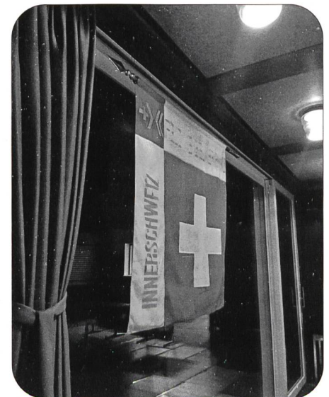
Das alte Sektionsbanner wurde mit viel Würde verabschiedet und in die verdiente Pension entlassen

Am Freitag, 15. November 2019 , nahm wieder eine mustergültige Fahndelegation der Sektion Innerschweiz, begleitet von einzelnen Sektionsmitgliedern, an der alljährlichen Schlachtfeier bei Morgarten teil. Die Sektion erfüllte dabei ihre Pflicht so diszipliniert und ehrenvoll wie alle vergangenen Jahre. Am Abend des gleichen Tages fand in Goldau, im Restaurant Gotthard, der Garderapport statt. Verschiedene Sektionsmitglieder folgten der Einladung des Bannerherrn um in ungezwungener Atmosphäre das Sektionsjahr Revue passieren zu lassen und die Kameradschaft zu pflegen.