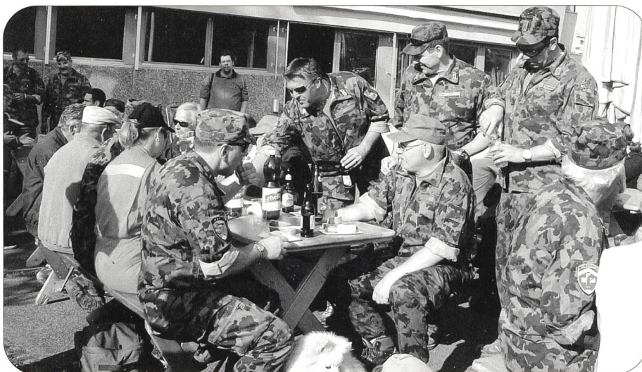
Auch weiterhin wird die Sektion Innerschweiz mit Aktivitäten und Kameradschaft aufzurufen

dazu wird den Sektionsmitgliedern an der kommenden Generalversammlung, bei der wir hoffentlich auf viele Sektionsmitglieder zählen dür-