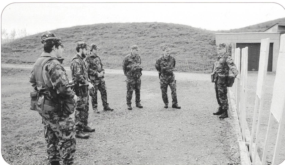
Ob im Theorieraum oder auf dem Feld, wichtig sind ein guter Mix und die gute Qualität der Anlässe der Sektion Innerschweiz

Dies ist die letzte Berichterstattung der Sektion Innerschweiz in der Armeelogistik. Die Sektion wird sich weiterhin mit Berichten und Informationen an die Sektionsmitglieder wenden. Weiteres