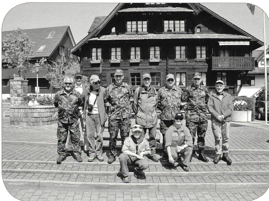
Auch in diesem Jahr startet wieder eine stattliche Anzahl Sektionsmitglieder am MUZ, dem traditionellen Marsch um den Zugersee.

Am Donnerstag, 4. April 2019, beteiligte sich die Sektion Innerschweiz zum dritten Mal an der Näfeler Fahrt, also an der