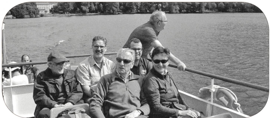
Sicher gibt es auch im 2019 wieder spannende und interessante Übungen für die Sektionsmitglieder (Bild von der Übung Ghandi 2014).

Die weiteren Anlässe und der genaue Terminkalender werden in der nächsten Armeelogistik ausführlich beschrieben und vorgestellt.