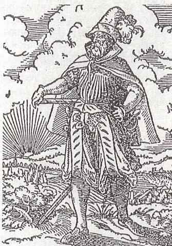
Der Feldweibel (Jost Amman 1539-1591)