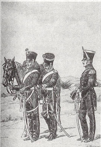
Feldweibel aus dem 1. Weltkrieg.

Die Beförderung zum Feldweibel erfolgte vom Wachtmeister oder Fourier, ausnahmsweise auch vom Korporal aus. Je nach Waffengattung waren die Beförderungsvorschriften sehr unterschiedlich. Eine Fw-Ausbildung, wie wir sie heute kennen, gab es noch nicht. Das Bestreben des Fw nach einer Besserstellung in Richtung Offizier bestand schon im 19. Jahrhundert. Viele Fw organisierten sich im UOV (Unteroffiziersverein) und versuchten auf diesem Wege eine Besserstellung zu bewirken. Zum Beispiel stellte der UOV Zürich 1872 ein Gesuch an die kantonale Militärdirektion, dem Feldweibel das Tragen des Gewehres zu erlassen. Die kantonale Militärdirektion unterstützte dieses Begehren, das Eidg. Militärdepartement lehnte es jedoch ab.