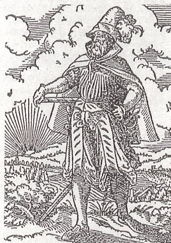
Der Feldweibel (Jost Amman 1539-1591)