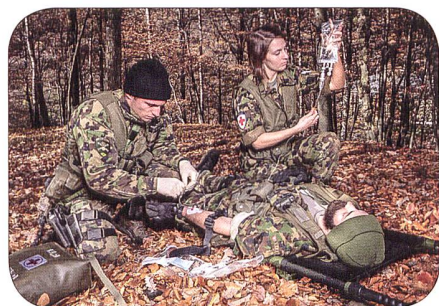
RKD Aerztin im Feld