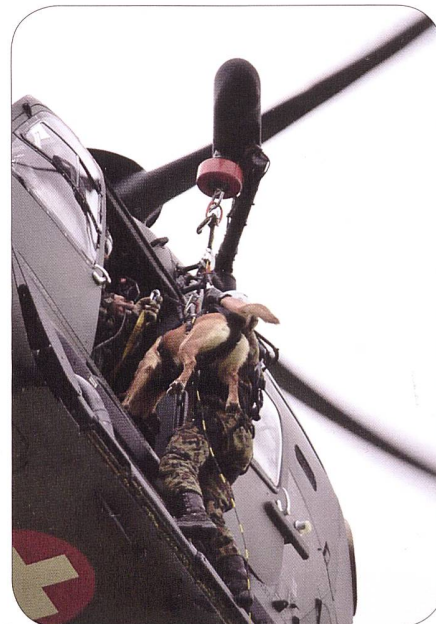
Hundeführer und Hund beim Ausstieg