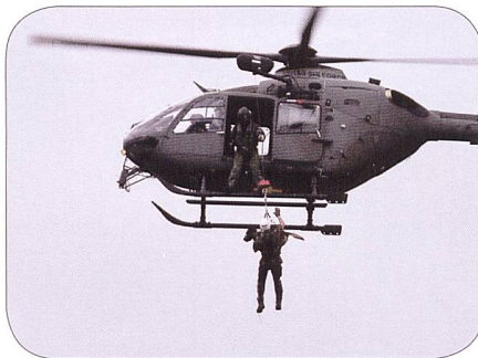
Hundeführer und Hund seilen sich ab