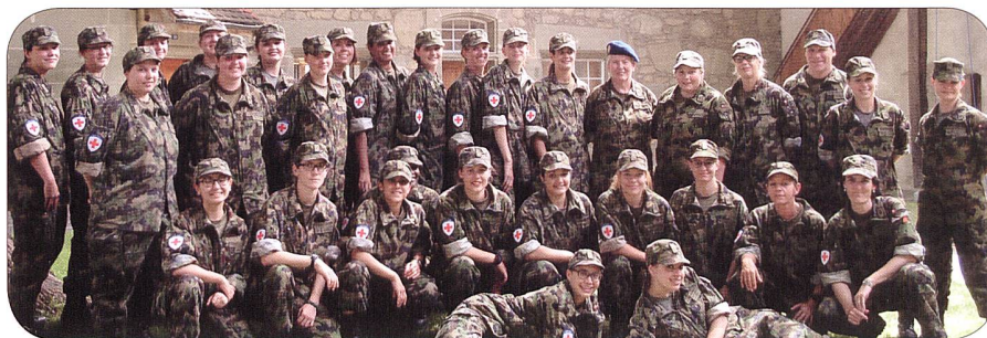
RKD RS Juli 2017