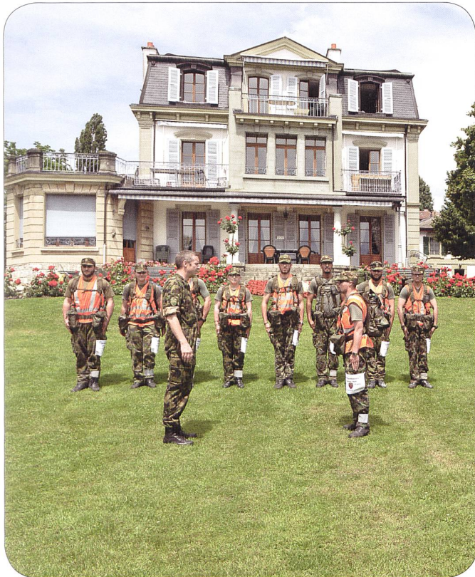
Start in Verte Rive, Pully