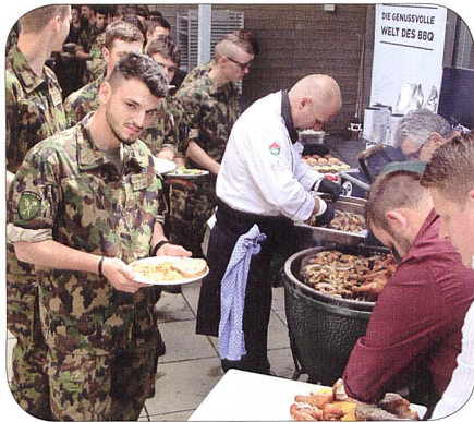
Zubereitung Fleisch am BBQ