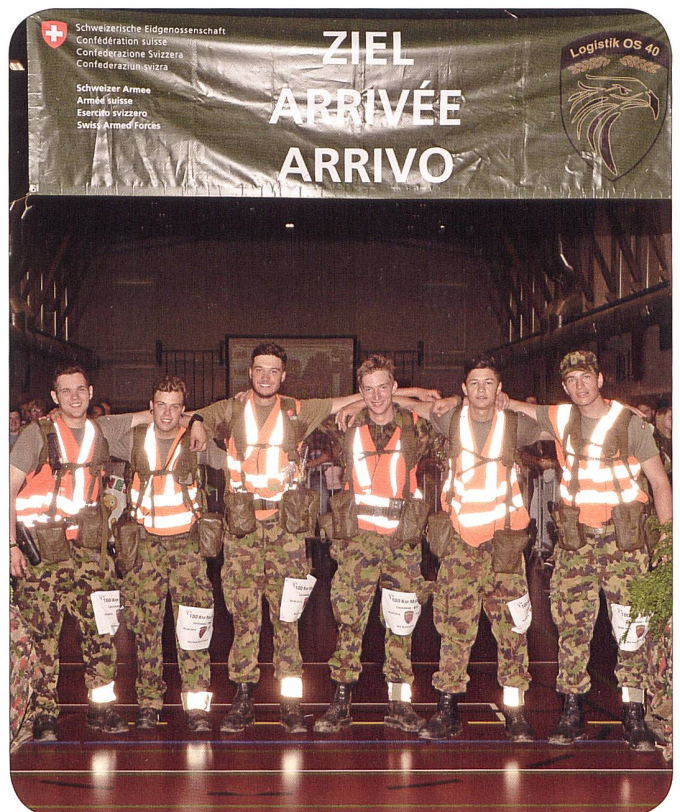
Ziel Kaserne Bern