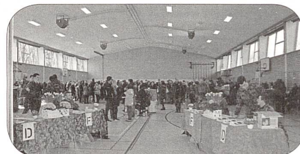
Empfang der Besucher in der Mehrzweckhalle Drognens

Auf dem ersten Arbeitsplatz wurde allen Besuchern die Gefechtsausbildung am Beispiel eines Begegnungsgefechtes dargestellt. Die einzelnen Schritte und Sequenzen wurden mit einfachen Worten erläutert. Als Besucher hatte ich grosse Freude festzustellen, dass in der Ns RS 45 die Gefechtsausbildung verbessert und ausgebaut wurde. Der Schulkommandant: «Neben dem Wachtdienst muss sich auch jeder AdA in einer Gefechtssituation zurechtfinden können. Deshalb haben wir das Ausbildungsschwergewicht zugunsten der Gefechtsausbildung angepasst. Die Schule kann von den Erfahrungen einzelner junger Berufsmilitärs mit Infanterieausbildung sehr profitieren.»