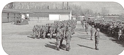
Präsentation der Kompanien

Nach der Präsentation der Kp wurden die Kader einzeln vorgestellt. In den Zugschulen wurden lustige Elemente eingebaut und brachten mit ihrer Darbietung die Eltern zum Lachen.