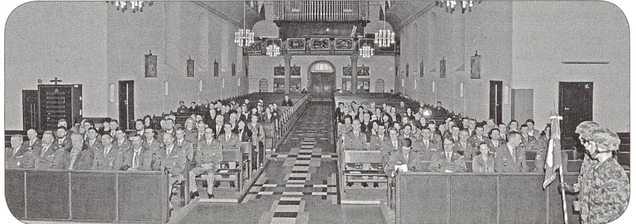
Teilnehmer in der Kirche Sivrizez

conduire un véhicule qu'une année après avoir réussi le permis. Pour ce qui est du commandement c'est pareil.