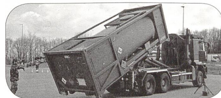
Betrieb eines Versorgungsplatzes

Die Rekruten präsentierten die für die Logistikformationen verfügbaren Fahrzeuge und die Umschlaggeräte im Einsatz. Interessant war das Aufeinanderschichten von Plastikfässern zu einem hohen Turm. Diese Arbeit erfordert