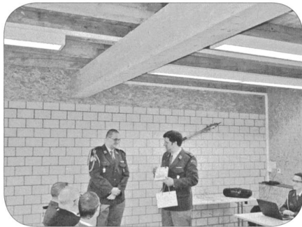
Verabschiedung Four Schelker als Sektion-TL