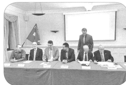
Der Vorstand Sektion NWS an der GV

Der Sektionsvorstand stellte eine Liste von Tätigkeiten zusammen, die seiner Meinung nach für den Erhalt der Sektion wichtig sind und beibehalten werden sollen, nämlich: Die Generalversammlung; der monatliche Stamm, der auch einmal ausserhalb Chur stattfinden darf; die freundschaftlichen Verbindungen zum Gruppo Furieri Poschiavo, deren Mitglieder mehrheitlich auch Mitglieder der Sektion Graubünden sind; und die freundschaftlichen Verbindungen zum Reserve-Unteroffiziers-Corps (RUC) Reutlingen. Diese wurden vor vielen Jahren von unserem verstorbenen Ehrenmitglied, Four Fritz Andres, ins Leben gerufen und von dem inzwischen ebenfalls verstorbenen Ehrenmitglied, Gfr Luzius Raschein, weitergepflegt.