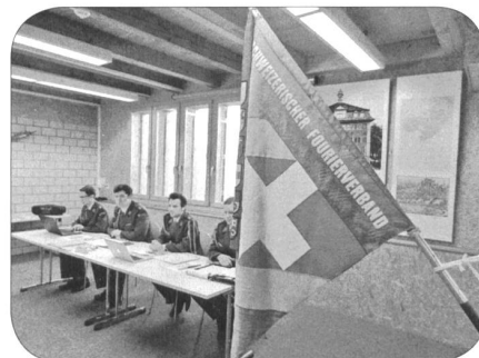
Der aktive Vorstand

06.03.18 Stamm, Restaurant Joel's, Luzern