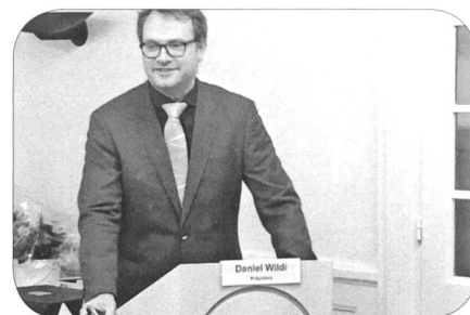
Four Wildi an der GV der Sektion NWS