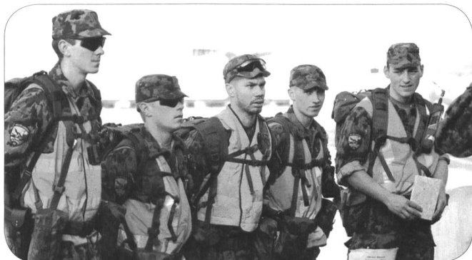
Gäste von der Luftwaffe