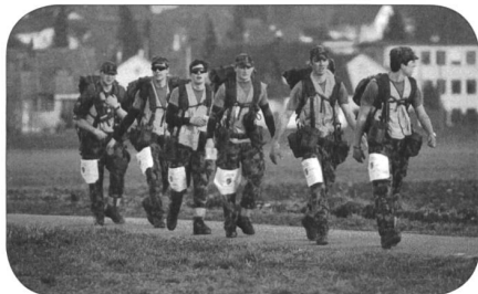
Es geht weiter