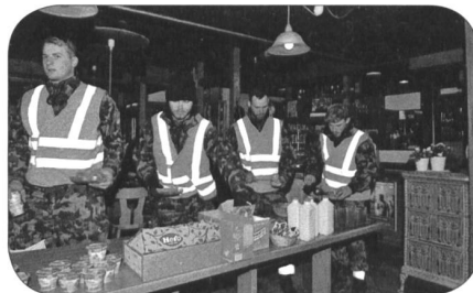
Frühstück ohne Schlaf