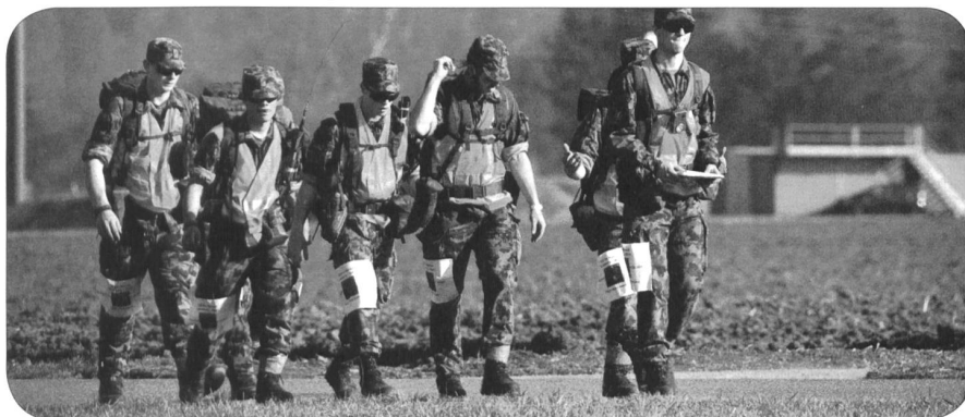
Frohen Mutes im Mittelland