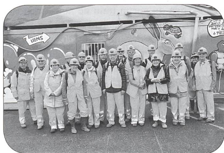
Tout le monde est prêt pour la visite.

Après toutes ces nombreuses explications et quelques questions des participants, chacun s'équipe d'un pantalon et d'une veste de couleur orange, de bottes et d'un casque jaune avec lumière, et se dirige sur le chantier du site en laissant sur la droite la tranchée couverte de Frank-Thomas. On s'engouffre tout d'abord dans ce que sera la nouvelle Gare des Eaux-Vives, puis en deux groupes, sécurité oblige, dans le tunnel en direction de la rue de Contamines en passant successivement sous les routes de Chêne, Théodore-Weber, Malagnou, Florissant, Contamines et ce, sur plusieurs centaines de mètres jusqu'à environ 600 m. de l'autre chantier du Plateau de Champel.