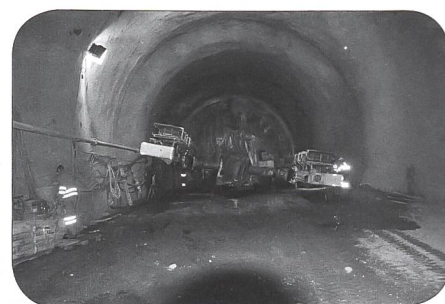
Au fond du tunnel en direction de Champel.

Vers 19 heures 45, après avoir passé toutes les commandes de repas et boissons, les pre-