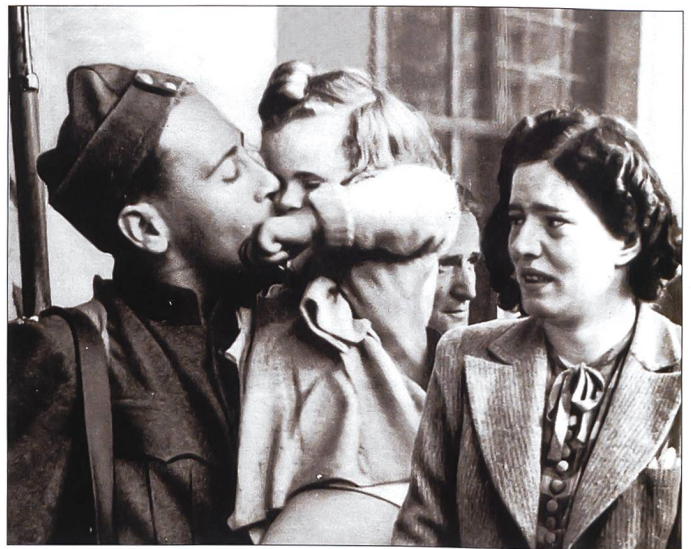
Die Aussage des Bildes gilt auch für künftige Mob.

Die Kapitel «Kalter Krieg», «Armee 95» und «Armee XXI» werden gekürzt und besser strukturiert. Dafür erhält die geplante «Armee von Morgen» viel Raum. Damit wir am 7. Mai 2016 eine attraktive und interessante erweiterte Ausstellung Mobilmachung eröffnen können, sind wiederum viele Arbeitsstunden unserer Freiwilligen notwendig.