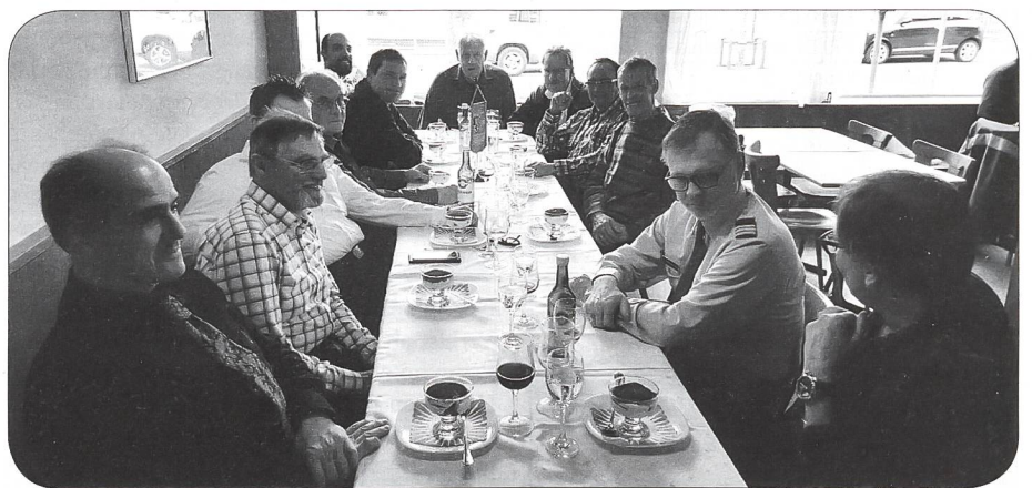
GV-Teilnehmer der Sektion Rätia

Ich mache mir die gute Information zur Gewohnheit und wünsche ARMEE-LOGISTIK jeden Monat in meinem Briefkasten. Zuerst zwei Monate gratis. Dann im preiswerten Abonnement: