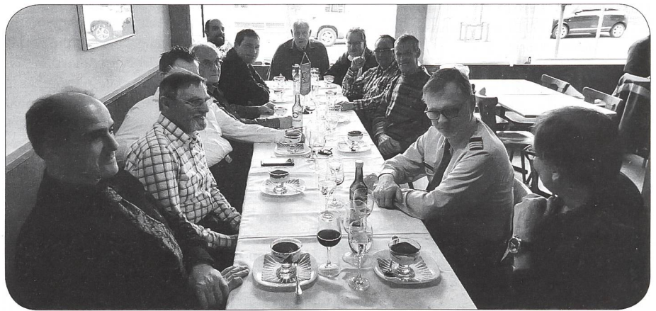
GV-Teilnehmer der Sektion Rätia

Ich mache mir die gute Information zur Gewohnheit und wünsche ARMEE-LOGISTIK jeden Monat in meinem Briefkasten. Zuerst zwei Monate gratis. Dann im preiswerten Abonnement: