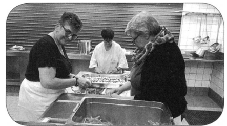
Unsere Helferinnen beim Bohnenwickeln

Allen Helferinnen und Helfern danken wir ganz herzlich für den gelungenen Einsatz, der auch dieses Jahr wieder von allen Seiten gerühmt wurde.