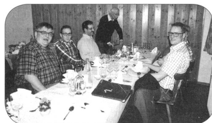
Gelöste Stimmung vor der GV

Ich mache mir die gute Information zur Gewohnheit und wünsche ARMEE-LOGISTIK jeden Monat in meinem Briefkasten. Zuerst zwei Monate gratis. Dann im preiswerten Abonnement: