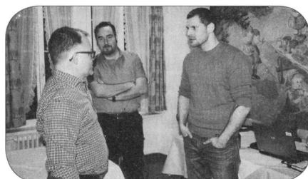
Diskussionen vor der GV