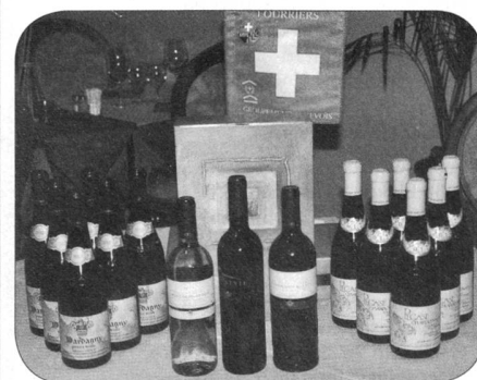
La planche des prix

Alors que certains souhaitaient venir s'échauffer et affûter leurs armes (aux cartes) dans l'après-midi, que «nenini», les portes du restaurant n'ouvraient qu'à 17 heures 30. C'est ainsi que peu après 18 heures, les quatre