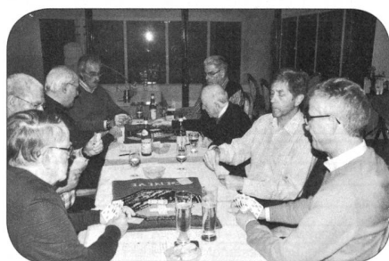
Les 4 équipes s'affrontent...

Chacun est reparti chez lui avec une, deux ou trois bouteilles de pinot gris ou chardonnay et les vainqueurs avec chacun trois bouteilles de bons vins genevois!