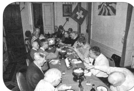
Les participants attaquent la fondue

propriétaire des lieux, le Général Dufour (1787-1875) qui avait fait bâtir cette demeure et qui y passa les dernières années de sa vie. Le drapeau du groupement est déployé, la traditionnelle marmite est installée en bonne place, des papillotes rouges et jaunes ornent la table où bientôt les caquelons à fondue rejoindront les bouteilles de blanc, genevois bien sûr. Cafés, pousse-café, les premiers pétards créent l'ambiance et, à coups de 2 Fr. la mise, chacun s'efforce d'estimer le poids de la marmite. Le président demande le silence, donne connaissance des noms de quelques excusés, remercie de généreux donateurs et présente aux membres les vœux du comité pour la nouvelle année qui approche. Il donne la parole à l'orateur pour la partie officielle et historique.