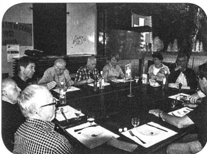
Rayon fruits et légumes frais