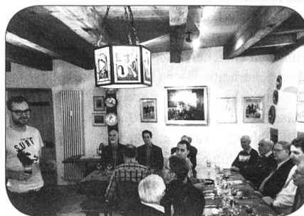
Stimmungsbild vom Neujahrsstamm 2014

waf / Am Mittwoch 07. Januar 2015 findet der traditionelle Neujahrsstamm in der Stube vom Artillerieverein Basel-Stadt, im St. Johannis-Tor statt. Die Einladung zu diesem Anlass erfolgt mit dem nächsten Versand im Dezember.