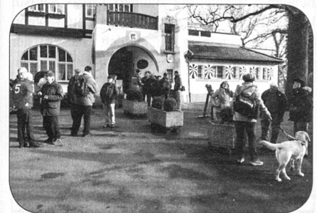
Stimmungsbild vom Winterausmarsch 2014

Dies war der Endpunkt des letzten Winterausmarsches. Die Einladung zu diesem Anlass erfolgt mit dem nächsten Versand im Dezember.