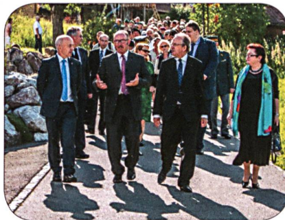
Fussmarsch durch Schwarzenegg