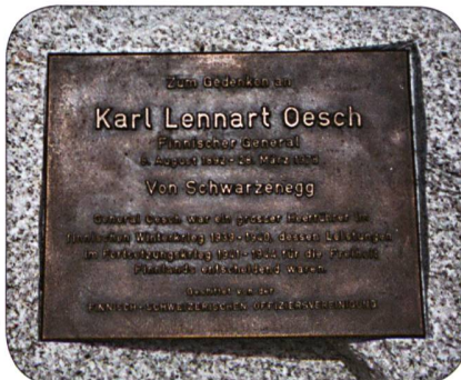
Inskrift Erinnerungstafel General Oesch