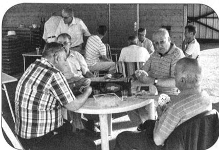
Les acharnés du jass!