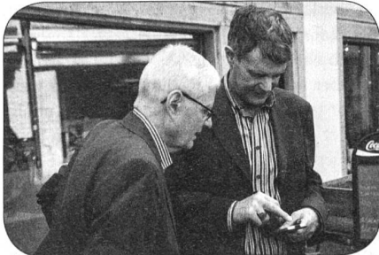
Ehrenmitglieder unter sich