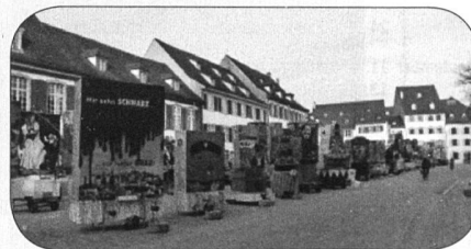
Dieses Thema war zwar letztes Jahr aber...

Auch die Basler Fasnacht ist mittlerweile vor- bei. Es war bunt, warm und schönes Wetter. Am Dienstagmorgen schaute ich mir die La- ternen an, die meisten stehen auf dem Müns- terplatz.