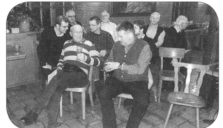
Teilnehmer der GV

ALVA lädt alle Mitglieder zur Besichtigung des ALC in Othmarsingen (ehemals AMP) ein. Genauere Details werden nach der Anmeldung bei patrick.riniker@alvaargau.ch direkt erfolgen. Der Anlass startet um 15.30 Uhr in Othmarsingen.