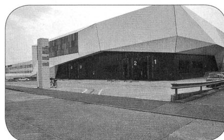
Vue de l'extérieur du bâtiment du CICR

A l'intérieur, nous découvrons le volume impressionnant de cette halle dont le rez surélevé mesure près de 10m de hauteur. Chaque ligne de rayonnages est conçue pour loger les palettes dans ses 3500 alvéoles auxquelles on accède au moyen d'élévateurs équipés