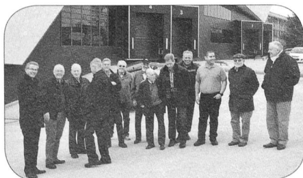
Les membres du groupement genevois présents à la visite

On nous présente encore un petit film qui présente le travail des délégués sur leurs lieux d'intervention. Une grande attention est por-