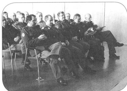
Des participants attentifs

Bereits erfolgte Anmeldungen wurden wei-