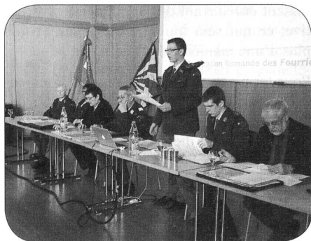
Le comité ARFS