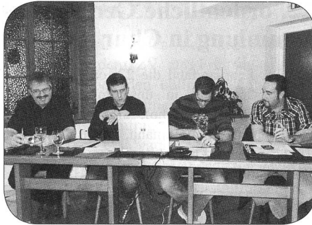
Gut gelaunter Vorstand

Der erste Stamm im Jahr vom 7 März 2013 lockte 12 Kameraden an. 18 Kameraden ent-