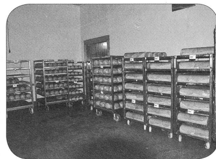
Jambons et autres spécialités prêts pour l'expédition