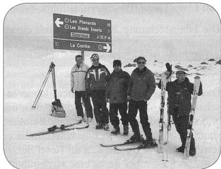
Le groupement valaisan dans la neige

Une journée mémorable pour les fourriers du Groupement valaisan et que vive la camaraderie!