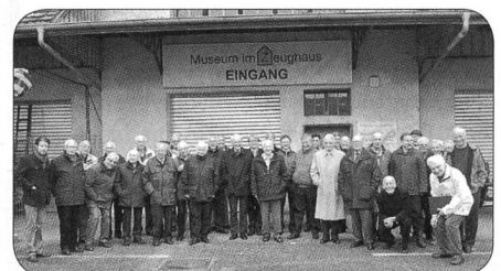
Die Teilnehmer vor dem Museum im Zeughaus in Schaffhausen.