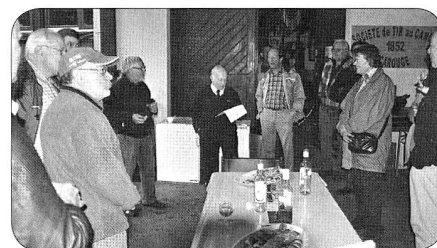
Proclamation des résultats