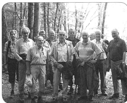
Le groupeement genevois en ballade

Cbr - Le rendez-vous était fixé à 17h30 précHG - Houlà..., nombreuse participation pour notre traditionnelle balade-découverte