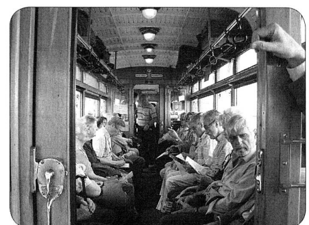
Le charme d'antan