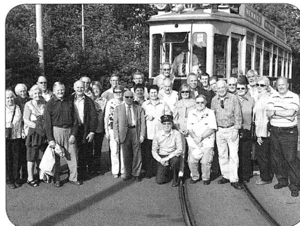
Oui, il y avait suffisamment de places...