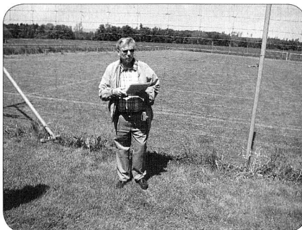
Proclamation des résultats

mw – Une vingtaine de membres des groupements de Berne et fribourgeois, accompagnés pour la plupart de leur épouse, partenaire et