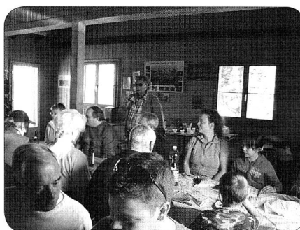
Toutes générations confondues