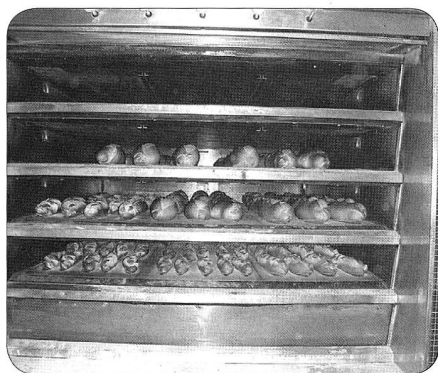
Prêts à être consommés!

couvre-chefs précède le début du parcours qui commence à la boulangerie. La farine blanche est issue directement du moulin mitoyen et arrive en vrac au-dessus des pétrins où un seul homme prépare toutes les pâtes. Les autres farines parviennent en sacs, car en quantités moindres. Pour transformer la pâte en chacune des 25'000 pièces cuites chaque jour, une peseuse volumétrique façonne les pains bâtards ou en baguettes, tandis qu'une autre machine prépare les petits ballons de 50 à 135 g. Tout cela va transiter par des fours statiques ou rotatifs après avoir subi le processus de fermentation. L'entreprise travaille 7 jours sur 7 et livre ses produits bien au-delà des limites du canton, jusqu'à Lausanne, Berne ou même La Chaux-de-Fonds.