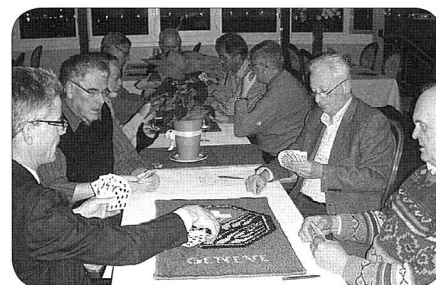
Tapis de luxe pour le jass!

MW – C'était un vendredi 13... ce qui n'a pas empêché plus de vingt membres et épouses de venir au restaurant Brunnhof fêter la nouvelle année et déguster la traditionnelle fondue au fromage (exercice FaF). Le repas a été suivi du non moins traditionnel loto gratuit mais tout de même doté de magnifiques prix. Belle soirée qui s'est déroulée à merveille dans une ambiance très amicale.