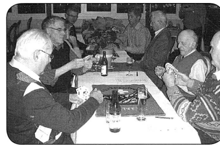
Chacun est concentré!

Les résidents locaux ont démontré un inhabituel fair-play en laissant leurs adversaires truster les meilleures places. La classe, quoi! Malgré l'attelle qui protège son bras cassé lors d'une récente et malencontreuse chute, notre président a... présidé, en s'assurant de la régularité du concours remporté avec force imprécations et sanglots par le châtelain de Peney et