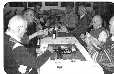
Chacun est concentré!

Les résidents locaux ont démontré un inhabituel fair-play en laissant leurs adversaires truster les meilleures places. La classe, quoi! Malgré l'atelle qui protège son bras cassé lors d'une récente et malencontreuse chute, notre président a... présidé, en s'assurant de la régularité du concours remporté avec force imprécatons et sanglots par le châtelain de Peney et