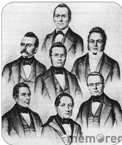
Der erste Bundesrat 1848; Ulrich Ochsenbein, erster links, Mitte

Die Kommissionsarbeit erfolgt in vier Sektionen unter Ausschluss der Öffentlichkeit. Nach 51 Tagen, am 8. April 1848, ist die Arbeit der Verfassungsrevisionskommission beendet. In der Tat eine unerreichte Meisterleistung!