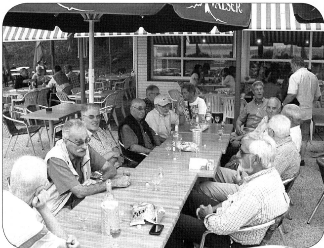
Le groupement à table ...