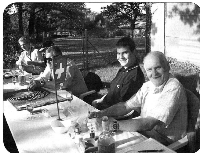
Jeune et moins jeune, tout sourire!

Verantwortung übernehmen – klimaneutral drucken