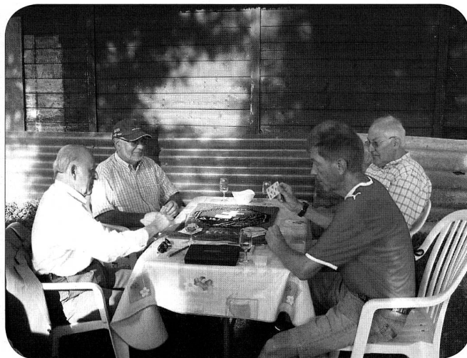
Concentration avant tout!