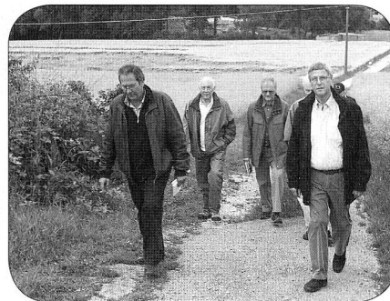
En pleine marche...