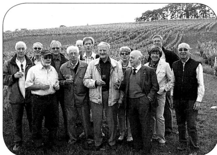
Vignes derrière – produit dans les verre!