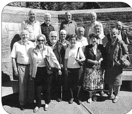
Les anciens du comité central ASF

HG - Depuis fort longtemps, les anciens du comité central et de la commission technique centrale qui avaient assumé le Vorort romand