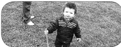
sait-on jamais, peut-être un futur fourrier...