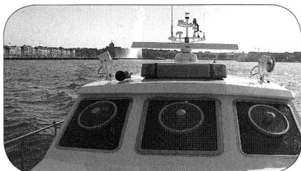
à bord de la vedette avec le Jet-d'eau en arrière-plan