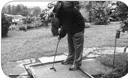
notre président très concentré