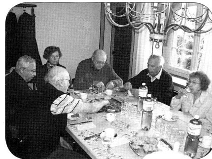
à l'heure de l'apéritif