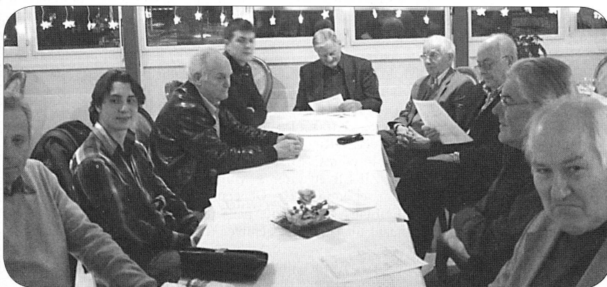
Une partie des participants à l'AG