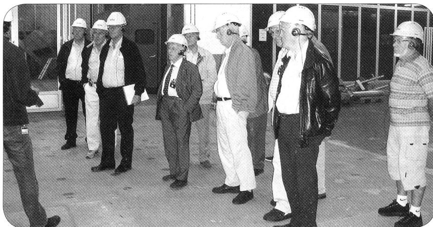
Les participants attentifs aux explications

Au tout début, ils ne traitaient que les déchets genevois. Après les extensions et afin de rationaliser les installations, le rayon de récupération a été agrandi hors du canton de Genève pour finalement se reconcentrer sur le canton de Genève, vu que d'autres régions se sont équipées d'installations similaires.