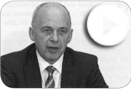
Bundesrat Ueli Maurer anlässlich der Medienkonferenz vom 15.04.2010

und entwicklungspolitisch zusammen; im militärischen Bereich ist sie zurückhaltender. Sie wird auch in Zukunft ihre dauernde und bewaffnete Neutralität beibehalten. Die Schweiz arbeitet auch im militärischen Bereich mit ausländischen Partnern zusammen, sofern es ihren Sicherheitsinteressen dient.