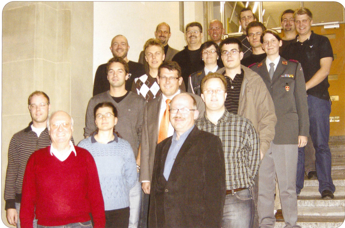
BERN. – Gemeinsam organisierten die Dachverbände SOLOG und SFV zusammen mit der LBA, Truppenrechnungswesen, in Luzern, Kloten und Bern einen Aus- und Weiterbildungskurs. Aus erster Hand wurden die Teilnehmer über alle Neuerungen im Kommissariatsdienst, beim Verpflegungsdienst und in der Truppenbuchhaltung umfassend auf dem Laufenden gehalten. Fazit: Allseits zufriedene und dankbare Teilnehmer.