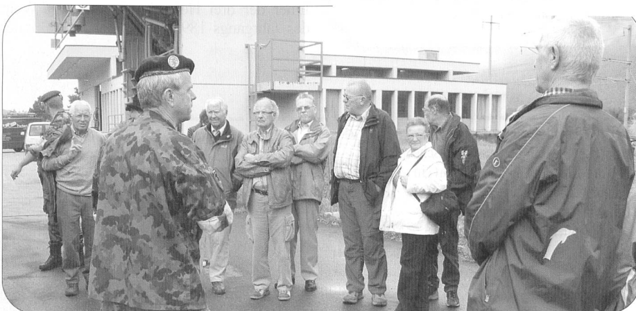
Leider reichte der Platz nicht aus, verschiedene exklusive Beiträge in dieser Ausgabe zu publizieren. Dazu gehört ebenfalls der Pensioniertentag der Hellgrünen vom 9. Oktober in Mels (unser Bild). ARMEE-LOGISTIK wird das Versäumte in der nächsten Ausgabe nachholen.