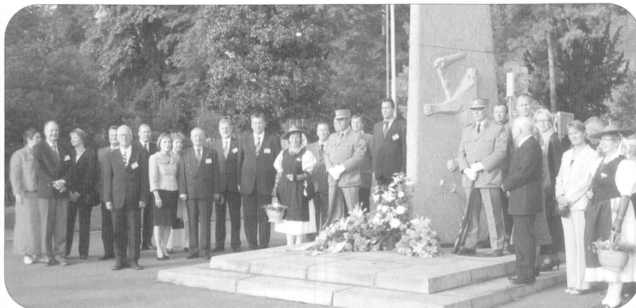
Am vierten Tag wohnten die finnischen Logistikoffiziere einer eindrucklichen Zeremonie am Denkmal von Maréchal Mannerheim in Montreux bei.

ARMEE-LOGISTIK-Leser erinnern sich: Vor zwei Jahren waren während einer ganzen Woche finnische Logistikoffiziere mit Begleitung Gäste bei der SOLOG. Kürzlich traf nun eine Gegeneinladung ein.