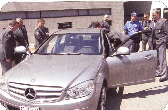
Interessiert zeigten sich die Logistik-Offiziere der Schweizer Armee über die hochmodernen Einsatzmittel der Aargauer Polizei für ihre täglichen Einsatz im Dienste der Allgemeinheit.