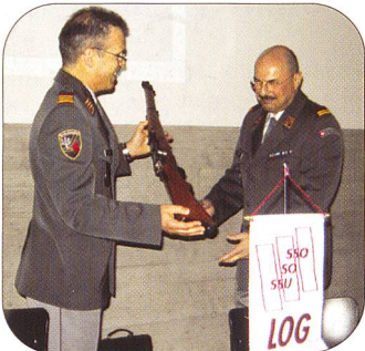
Drei Nationalräte beehrten die Logistiker mit ihrer Anwesenheit (oben). Ebenfalls durften die verdienten Ehrungen nicht fehlen.

Am 13. Juni trafen sich die Mitglieder der SOLOG und zahlreiche Ehrengäste beim Kommando Mobile Einsatzpolizei MEPO in Schafisheim zur 13. Mitgliederversammlung. Mehr über diesen eindrücklichen Anlass finden Sie ab Seite 3 in dieser Ausgabe! (-r.)