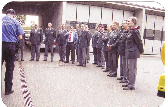
Die Aargauer Polizisten scheuten weder Aufwand noch Mühe, ihre anspruchsvollen Einsatzmöglichkeiten im Dienst der Sicherheit für die Bevölkerung vorzuführen. Dabei fanden sie interessierte und staunende Zuhörer.