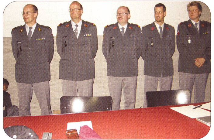
Tagein und tagaus stehen die fünf Sektionspräsidenten im Einsatz.