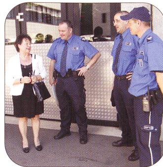
Ein Schwätzchen in Ehren kann niemand verwehren.