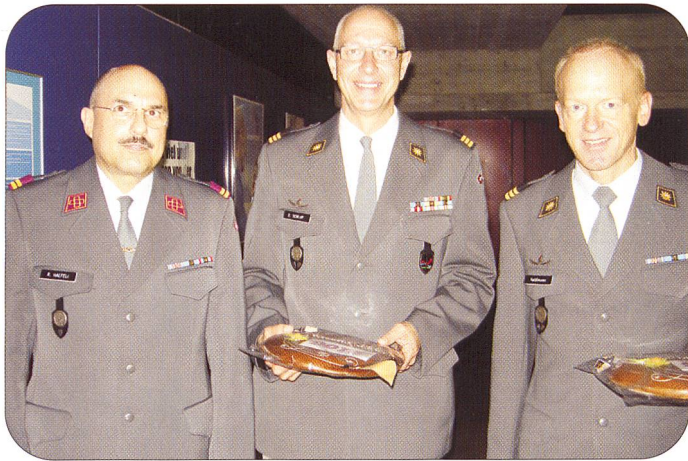
Immer wieder findet der «SOLOG-Lebkuchen» dankbare Abnehmer.