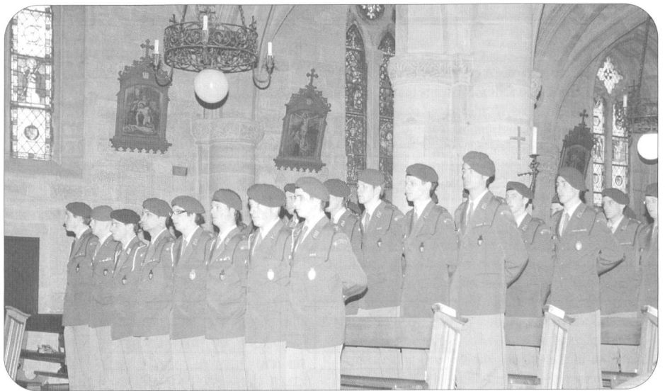
Viel Volk gab den Beförderten in der Stiftskirche Romont die Ehre.

Lesen Sie in einer nächsten Ausgabe: Die Verkehrs- und Transportschulen 47