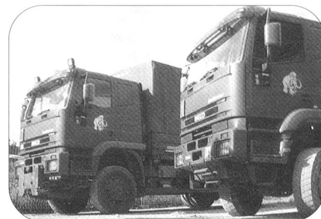
Die Fahrzeuge mit dem Mammut-Logo – unterwegs auf Schweizer Strassen oder hier im Fuhrpark der Mob Log Ber Kp 104.

Stalden im Emmental, 0830 Uhr. Am Standort der Mob Log Ber Kp 104-1 geht der Auftrag in der Transportzentrale ein. Oberleutnant Martin Geisser ist Zugführer des Durchdiener-Transportzuges und damit auch zuständig für die Transporteinsätze. Er prüft den Auftrag, entscheidet, welche Motorfahrer seines Zuges und welche Fahrzeuge aus dem grossen Fuhrpark der Kompanie eingesetzt werden und nimmt den Befehl in die Planung für den übernächsten Tag auf.