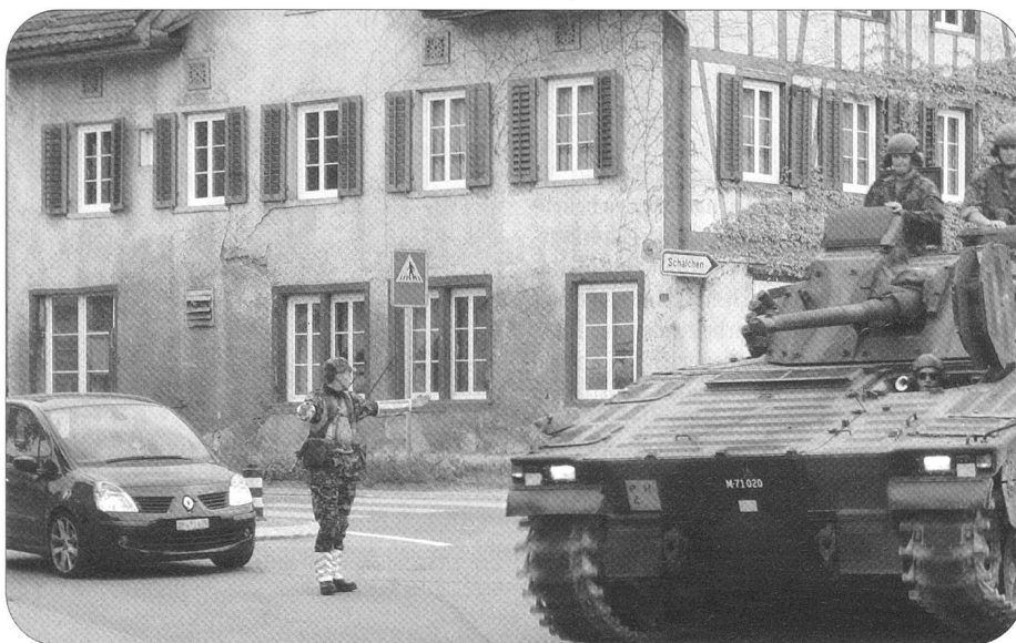
Panzerverschiebungen zu Gunsten von Schulen oder WK Verbänden sind die Hauptaufgabe des Verkehrszuges der Mob Log Ber Kp 104.

Lead: Die Logistikbrigade 1 (Log Br 1) verfügt mit den Durchdienern der Mobilien Logistik-Bereitschaftskompanie 104 (Mob Log Ber Kp 104) über ein Mittel der ersten Stunde. Die Kompanie besteht aus je einem Nachschub-, einem Transport- und einem Verkehrszug. Die Durchdiener stehen der Logistikbasis der Armee (LBA) im Bereich des Nachschubs und der Transporte sowie mechanisierten Verbänden bei deren Verschiebung zur Verfügung.