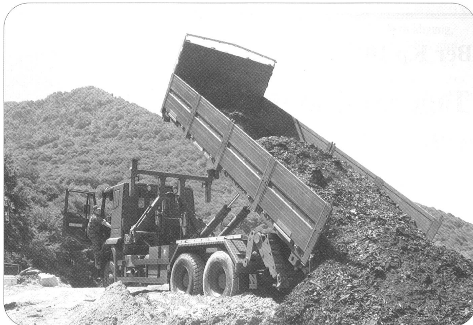
Transport von Gütern jeder Art – ob lose oder palettiert. Die Mob Log Ber Kp 104 verfügt über Transportmittel für die verschiedenen Einsätze.

den daher Informationen weitergegeben, Probleme in Bezug auf die Logistik und das Personal besprochen und die Einsätze der nächsten Tage abgestimmt. Zudem findet die Befehlsausgabe für einen Verkehrseinsatz zu Gunsten des Panzerbataillons 13 statt. Die Spezialisten des Verkehrszuges werden das Bataillon auf einer einwöchigen Übung im Raum Zürcher Oberland begleiten. Sie stellen dabei sicher, dass die mechanisierten Verbände ihr Ziel möglichst reibungslos erreichen und dabei militärische und zivile Verkehrsteilnehmer aneinander vorbeikommen. Dazu wird jede Strecke erkundet, eine temporäre Wegweisung erstellt, der Konvoi mit Motorrädern begleitet und an wichtigen Knotenpunkten der Verkehr geregelt.