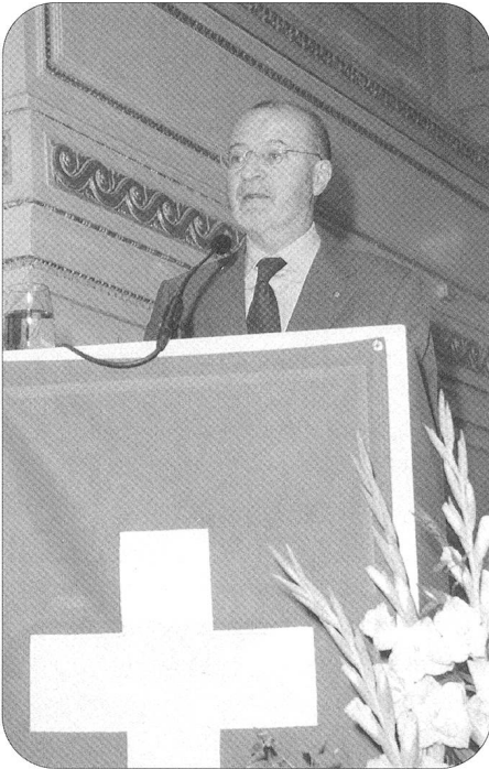
Monsieur le conseiller national Fulvio Pelli.