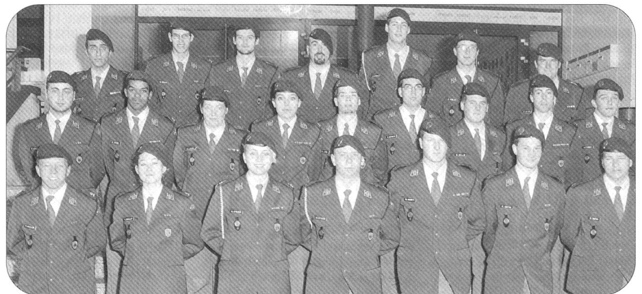
Ein Gruppenbild der stolzen Beförderten der Nach-/Rückschub-Schule 45-2.