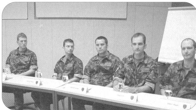
Die Vertreter der Dach- und Fachverbände der Schweizer Wirtschaft erhielten nicht nur Einblick in die Ausgestaltung der militärischen Führungsausbildung, sondern bekamen auch Gelegenheit, mit Absolventen den offenen Dialog zu führen.