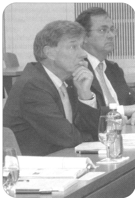
Gerold Bührer, Präsident von economiesuisse , ist erstaunt und zollt der Armee Hochachtung über die Dienstleistungen der Höheren Kaderausbildung – auch für die in- und ausländische Wirtschaft.

Beachten Sie zu diesem Thema auch die zweite Umschlagseite und die Vorankündigung einer weiteren Veranstaltung für Personalverantwortliche auf Seite 14!